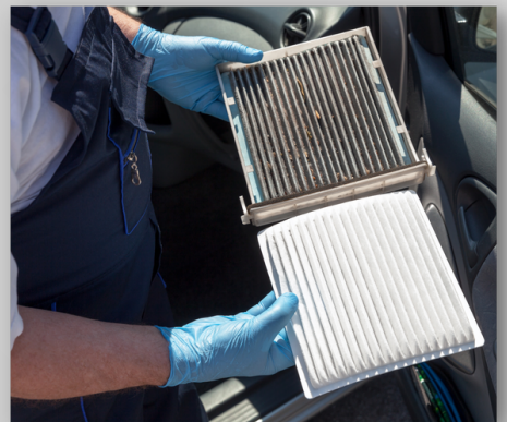
CARBURANT/AIR/ ALIMENTATION EN ENERGIE